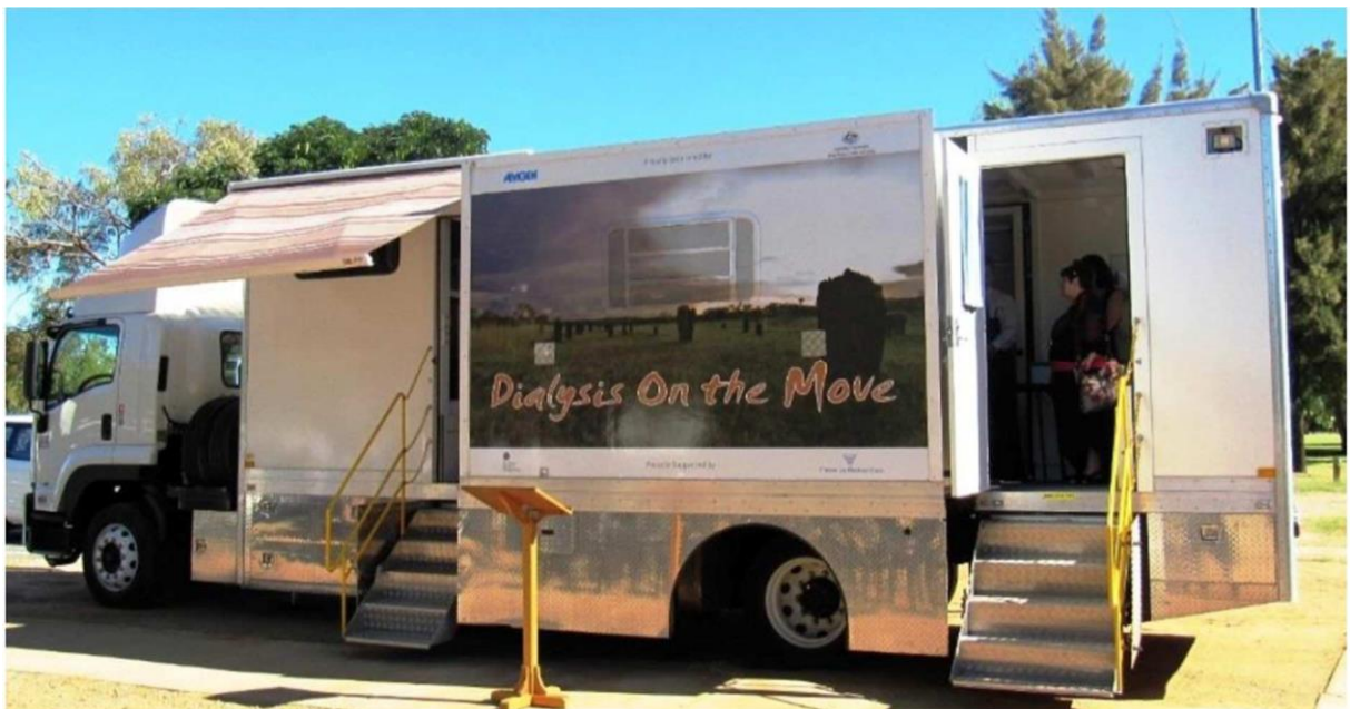
Le MedTruck pour dialyse.

C'est aux déserts médicaux et aux difficultés d'accès aux soins que souhaite s'attaquer MedTrucks. Pour cela, la startup développe des caravanes médicales qui permettent aux patients atteints de maladies chroniques de bénéficier de soins près de chez eux, et de vivre ainsi une vie « normale ».